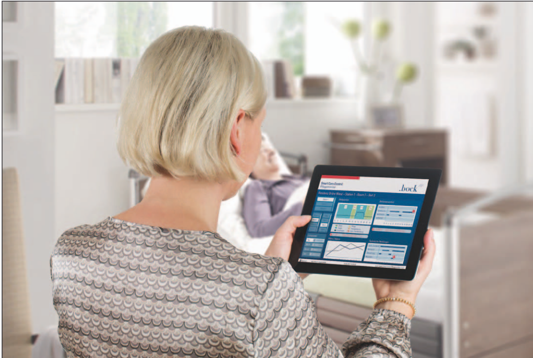
Bild 1: Eine App bietet einen schnellen Überblick über alle relevanten Daten des Pflegebedürftigen

Intelligentes Bettsteuerungs- und Überwachungssystem soll Fachkräftemangel entgegenwirken