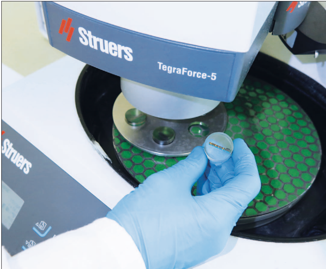
Bild 5: Schliffbilderstellung im Institut für Materialanalyse bei HTV

zu können, werden diese im laufenden Betrieb in einem sogenannten Burn-In höheren Umgebungstemperaturen ausgesetzt und damit künstlich gealtert. Ein anschließender Funktionstest deckt eventuelle Auffälligkeiten auf, die anschließend im Rahmen einer Fehleranalyse mithilfe verschiedener Methoden und Verfahren hochpräzise untersucht werden können.